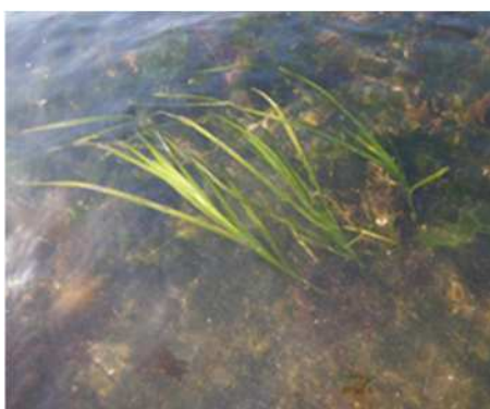
広島湾ブルーカーボン研究会