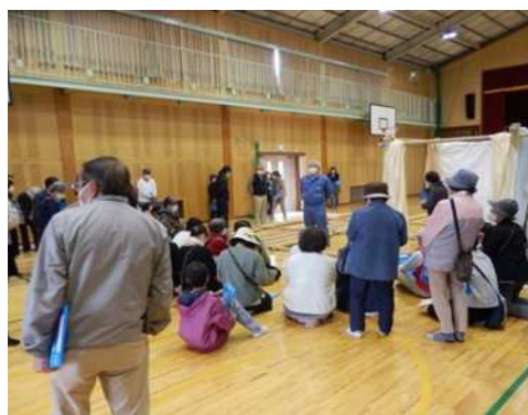
レジリエンス強化に向けた地域コミュニティ確認ツアー