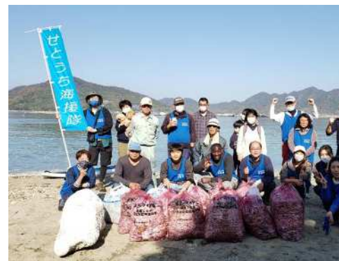
環境体験プログラムin江田島