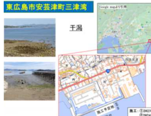
白砂青松の浜づくりプロジェクト