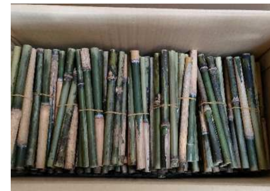
竹が繋ぐ「里山」と「里海」の循環と再生プロジェクト