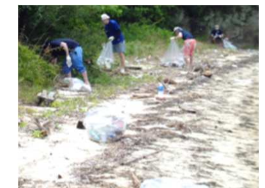
海ごみプロジェクト