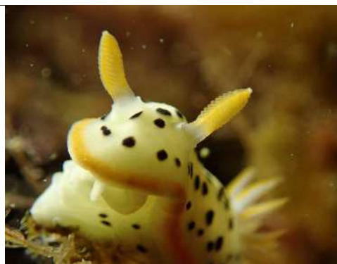
広島湾のウミウシ研究プロジェクト