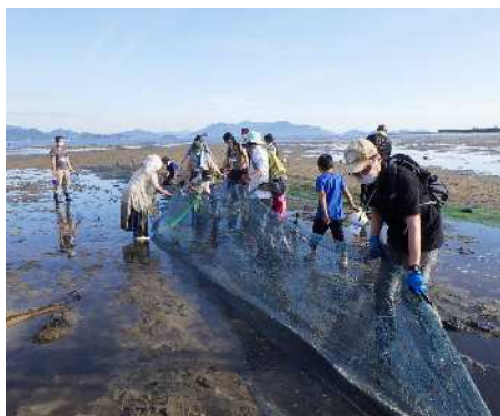
干潟再生プロジェクト